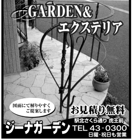
お見積り無料 TEL 43-0300 日曜・祝日も営業

営業時間 AM9:00~PM6:00 毎月曜定休 臨時休業 5/8(水) 大駐車場 完備 TEL 45-1953 駅裏さくら通り、塩屋交番を東へ150m カード取扱店 ほぼ全てのカードご利用いただけます