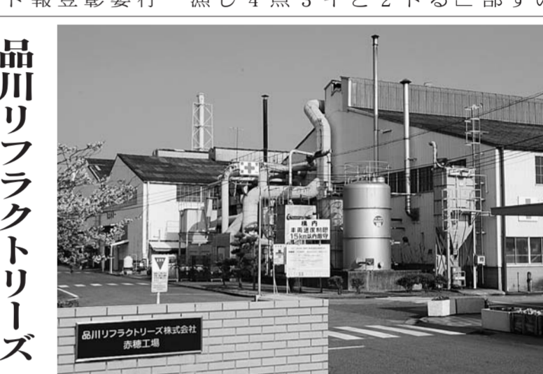
品川リフラクトリーズ株式会社 赤穂工場