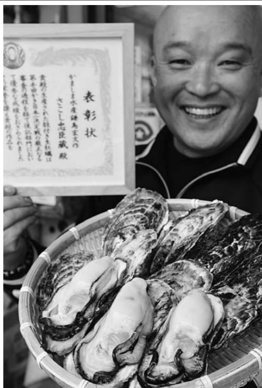
表彰状 さし忠臣蔵 さし忠臣蔵氏

「さし忠臣蔵」は、良形のものだけ選別して再び海で育てる「活かし込み」を3回以上繰り返す。「10000個のうち2〜3個(鎌島社長)」という最高級品で高級料亭やホテルなどに出荷される。品