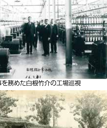
▲兵庫県知事を務めた白根竹介の工場巡視