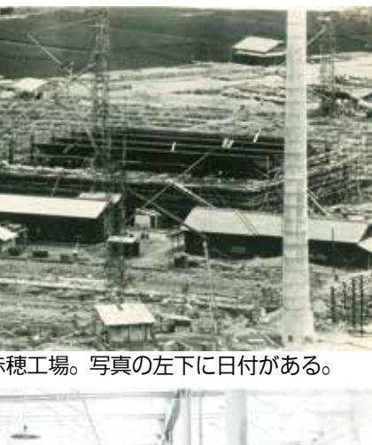
▲建設中の赤穂工場。写真の左下に日付がある。

塩とお米のお結び落語会 米朝一門で初笑い 18日からチケット発売 米朝一門の人気落家 が出演する「塩とお米 のお結び落語会」が来 年1月11日(月祝)にそ れぞれ日本遺産に認定さ れたことを受け、市文 化協会などが主催、市 「初笑い」米朝一門会 元禄赤穂事件の縁で 元禄赤穂事件の縁で