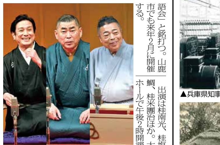
出演は桂南光、桂塩鯛、桂米團治ほか。大ホールで午後2時開演。