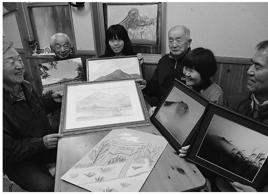
コンクールに絵画と写真38点

福岡地区産業廃棄物最終処分場建設反対赤穂市民の会（木村音彦会長）は1月23日（土）、弁護士を招いた学習講演会を開催する。入場無料。『反対運動を進めるため、一人でも多くの市民に参加してほしい』と来場を呼び掛けている。 講師は福岡県弁護士会所属の馬奈木昭雄氏（73）。九州大学法学部卒業後、昭和44年に27歳で弁護士登録した馬奈木氏は翌年に熊本県水俣市へ移住し、水俣病訴訟の被害者弁護団に加わった。その後、弁護士として数々の裁判で弁護士長を歴任。産廃処分場建設反対運動にも関わってきた経歴を持つ。 中広の赤穂市文化会館（ハートホール）小ホールで午後2時から、入場整理券を先着順に「地方再生と日本の将来」を題して講演する。聴講無料。同会議所窓口で所定の申込用紙に必要事項を記入し、入場整理券を先着順に配布している。定員になり次第終了。43・2727。（写真は講演会で来場する片山善博・元総務大臣）