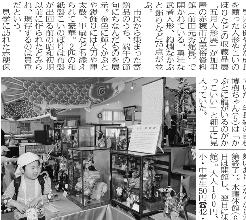
市民から集まった寄贈品のうち、端午の節句にちなんだものを展示。金色に輝くかぶとや鎧飾りには太刀や陣太鼓、軍扇なども添えられて豪華。2匹の和紙製のこいのぼりは布製が出来る前の昭和初期以前に作られたとみられ、現存するのは貴重だという。

「五月人形展」 民俗資料館 男児の健やかな成長を願った人形やこいのぼりなどの収蔵品展「五月人形展」が加里屋の赤穂市立民俗資料館(前田元秀館長)で開かれていた。男壮な武者人形、絢爛なかぶと飾りなど75点が並び、市民から集まった寄贈品のうち、端午の節句にちなんだものを展示。金色に輝くかぶとや鎧飾りには太刀や陣太鼓、軍扇なども添えられて豪華。2匹の和紙製のこいのぼりは布製が出来る前の昭和初期以前に作られたとみられ、現存するのは貴重だという。